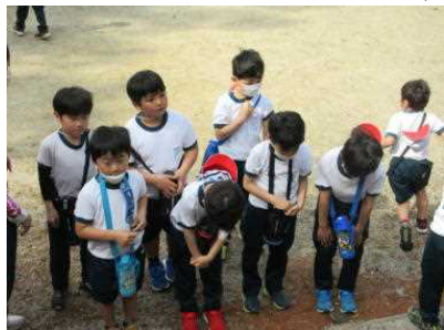
< 2年生：諏訪神社 >