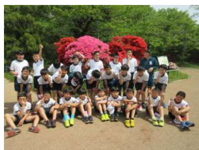
< 5年生：松ヶ岡公園 >