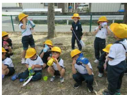
< 1年生：公園 >