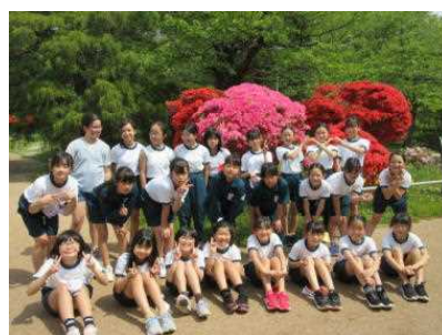
< 4年生：平浄水場 >