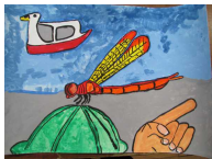
トンボの絵を描いたよ