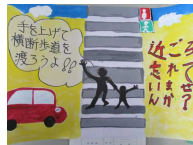
交通安全のポスターを描いたよ