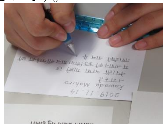
ネパール語に挑戦