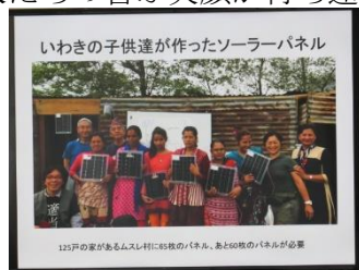
現地の人たちの笑顔