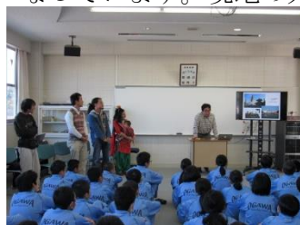
ネパールの山奥に住む人たちの生活について

実際に現地に届けるのは年明けになるようですが、その様子も私たちにお伝えしていただくことになっています。現地の人たちの喜ぶ笑顔が待ち遠しいです。