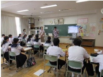
1年生：講師による出前講座

総合学習全日活動を行うに当たり、それぞれの学年が事前の準備を行ってきました。今後は、活動内容や活動を通して感じたこと、気づいたこと、考えたことなどをまとめる活動を行います。どのようなまとめになるか、楽しみにしています。