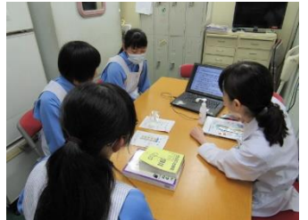
2年生：エリムでの活動 3年生：病院の職場体験