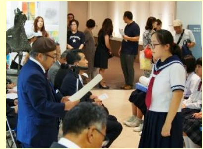
ビエンナーレ表彰式