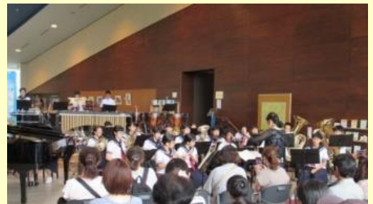
アトリウムコンサート