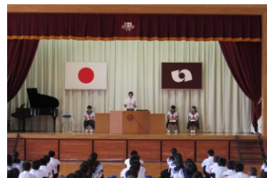
2学期の抱負(代表生徒)

2学期は、授業日数(登校日)が一番多い学期で、今年度は84日間になります。2学期には夏井祭を始めとした学校行事、中体連駅伝大会や新人戦などの部活動、職場体験学習や職業講話などの学習活動があります。特に大事になるのは学習です。"実りの秋"と言われるように、過ごしやすい気候となる中で学習に励み、努力の成果を実感できるようにすることが何よりも重要です。学校の一番の柱は"学習"です。その中心は授業です。そしてそれを補うのが家庭学習です。学校では"分かりやすい授業"の実現に向けて取り組んでいきます。生徒の皆さんも、まずは授業でしっかり吸収できるように取り組み、過程での継続した復習にも挑戦してほしいと思います。