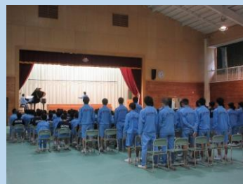
合唱コンクールリハーサル