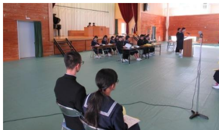
中央が前後期の生徒会執行部と各専門委員長