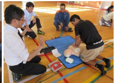
AED・心肺蘇生法の実技