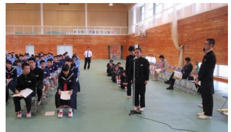
議題に対して質問する生徒