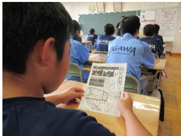
防災新聞で事前学習