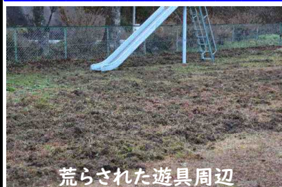
荒らされた遊具周辺