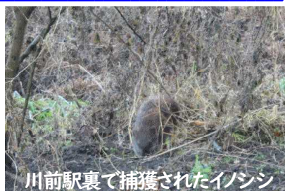
川前駅裏で捕獲されたイノシシ

校庭に突然現れたデコボコ模様。一夜にして、プールと遊具の周りが耕されたようになってしまいました。イノシシが夜間に掘り起こしたらしいです。専門家にも相談しながら、児童生徒が近寄らないように指導しています。