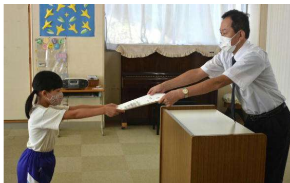
全校集会で読書感想文コンクールの表彰を行いました。(10月4日)