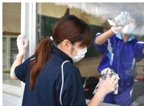
早朝より、奉仕活動に多くの皆様のご協力をいただきました。(10月2日)