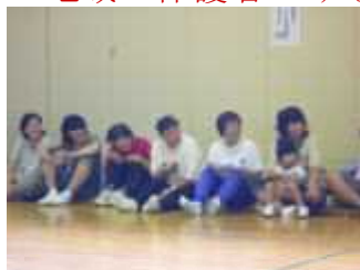
地域・保護者のみなさん