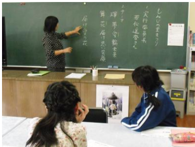
もみ里のテーマの話し合い

学校の木々の紅葉がはじまり、いよいよ「もみじの里まつり」が近づいてきたと感じる頃になりました。