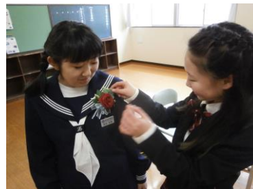
13日(木) 中学校卒業証書授与式前