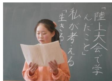
18日(火) 国語のスピーチ