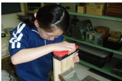
切り口をやすりで整え中