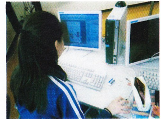
文集の表紙をPCで作成

春はまだ浅いこのごろですが、小学校の卒業式まで残すところ13日となりました。卒業文集や卒業制作に取り組んだり、最後の計算漢字コンテストが行われたりと様々な活動を通して、いよいよ卒業を迎えるのだなあと多く感じます。