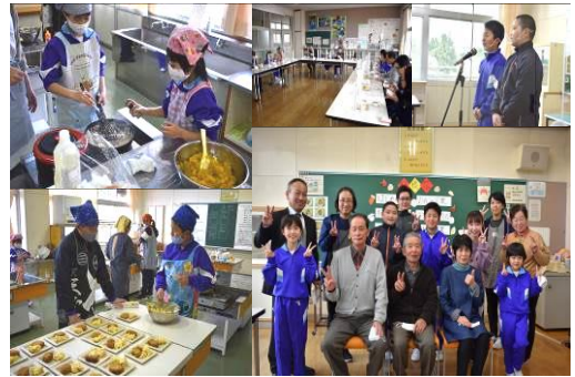
～ みんなの素敵な笑顔が並びました ～

新型コロナウイルスによる臨時休業によってスタートが危ぶまれた栽培活動でしたが、こうして子ども達に収穫の喜びを味わわせることができたのもバックアップくださった地域の皆様のお陰です。ご協力に心から感謝申し上げます。