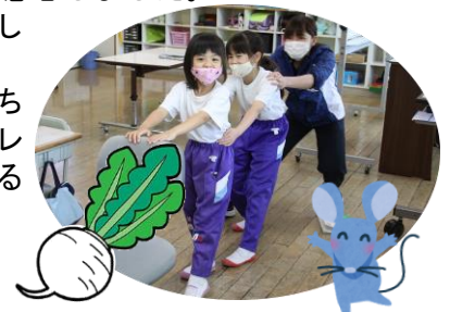
「うんとこしょ。」「どっこいしょ。」

連日、新型コロナ関連のニュースが繰り返し流れる中、自覚がある無しに関わらず、どの子も相当なストレスを受けています。子どもたちの不安や戸惑いに寄り添うことが必要だと改めて感じました。