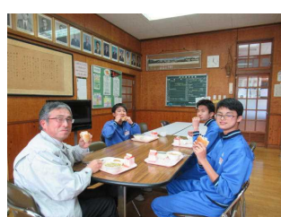
3年生との美味しい給食をいただきました