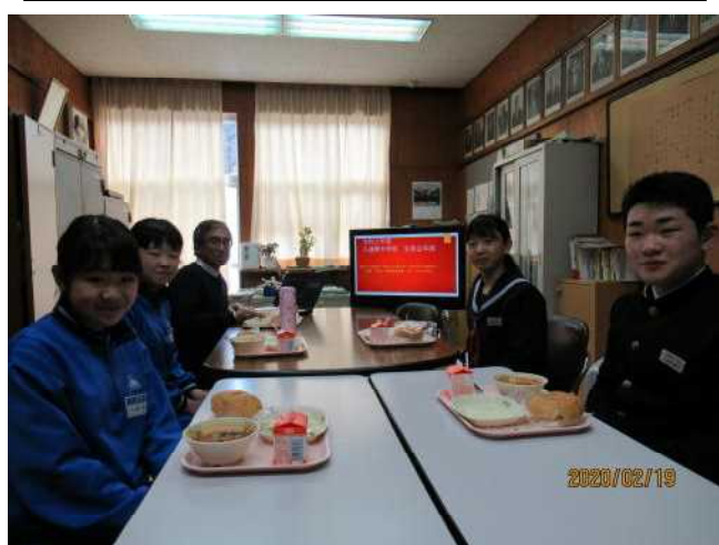
生徒会本部役員とランチミーティング中